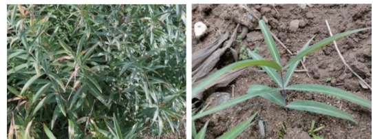
图2 黄精 P. sibiricum 种植地中叶的生长方式

的记载与《本草图经》的记载基本一致。但文献[26]中洪州黄精图(增强出版附加材料)与《本草图经》中的相州黄精图相似而简略;相州黄精图(增强出版附加材料)与《本草图经》中的洪州黄精图相似而简略。从《本草纲目》附图中可以清晰地看出黄精叶轮生,卵状披针形,叶片表面有纵脉纹,见增强出版附加材料。花序具约3~5朵小花,似成伞状。根茎横生,圆柱形,节间长,不是连珠状或姜块状。这些与植物黄精 P. sibiricum 较吻合。《本草原始》 [27] 的3幅药材图中有2幅为九蒸九制样品图,见增强出版附加材料。从药材图形来看与鸡头黄精,也就是黄精 P. sibiricum 的根相吻合。《本草汇言》 [28] 中的附图也是炮制后的样品图,也很像鸡头黄精,见增强出版附加材料。