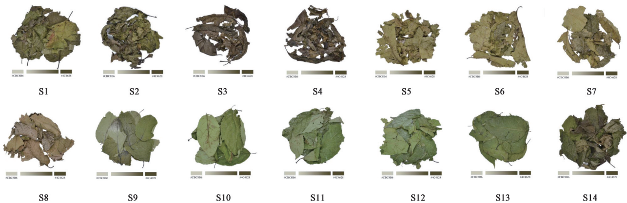
图1 14批杜仲叶样品照片