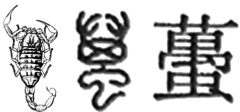
图1 甲骨文蚤的象形字

后为蚤。”“蚤”的甲骨文字象形于全蝎,见图1。《说文解字》中“蠹”和“蚤”均为螫人之虫。《广雅》云:“杜伯,蠹也。”《毛诗草木鸟兽虫鱼疏》 [21] 云:“蚤,一名杜伯,幽州人谓之蠹”。“杜伯”是周宣王的上大夫,无辜被杀,杜伯死后不久,周宣王巡游于城外,忽梦杜伯将其射杀,不久周宣王故。民间传说周宣王的死是杜伯报冤杀之仇。“杜伯”有狠毒之意,用此名比喻蝎螫人之狠毒。《蜀本草》 [22] 云:“蠹紧小者名蚘虫祁(虫旁祁)”;宋代苏颂 [23] 曰:“方书谓之‘蚘虫祁(虫旁祁)’”。“蚘”,《说文解字》释为鼠妇虫,刚出生1周的幼蝎,尾部卷曲在腹下,其形态与鼠妇虫有点相似;“虫祁(虫旁祁)”,《说文解字》和《康熙字典》中均无此字。“蚘虫祁(虫旁祁)”,《新本草纲目》 [24] 写成“蚘蚘”。结合“蚘”字的意思,“蚘虫祁(虫旁祁)”应该是根据小蝎子的形态而得名。“主簿虫”,《酉阳杂俎》 [25] 云:“开元初,尝有一主簿,竹筒盛过江,至今江南往往有之,俗呼为主簿虫”;李时珍 [26] 云:“主簿乃杜伯之讹,而后人遂附会其说”。按照李时珍的说法,“主簿虫”应是根据“杜伯”之名杜撰出的故事。“全蠹”,李时珍云:“今入药有全用者,谓之全蠹;有用尾者,谓之蠹稍”。自《开宝本草》 [27] 以“蠹”为正名,其后的本草著作均称“蠹”。蝎则为蠹的简化。现代药材名为全蝎、全虫。“全虫”是全蝎的处方简写。“钳蝎”是近代蝎目分类的称谓;“蝎子”为俗称;“问荆蝎”是依蝎的形态如同蕨类植物问荆,其形态像问荆的孢子囊穗。东亚钳蝎,大多文献记载其属于钳蝎属的蝎子,分布于亚洲东部从蒙古国到朝鲜的广大地区,因此,我国学者习惯称为东亚钳蝎 [28] 。产在山东的称“东全蝎”;产在河南的称“南全蝎”。产地加工加盐少或不加盐煮的为“淡全蝎”;加盐多的为“盐全蝎”。“春蝎”“伏蝎”是以采收季节命名的。“茯背虫”为《山西中药志》 [29] 记载的别名,应为“伏背虫”,刚产下的幼蝎伏于母蝎的背上,故名。