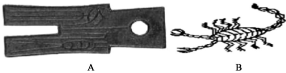
注:A:古刀币;B:古本草蝎绘图