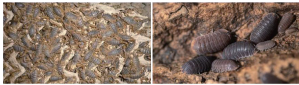
注:A.蝎子群居;B.鼠妇虫群居