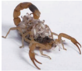
图3 负于母蝎背部的幼蝎