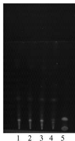
图 3 红杜仲 TLC 色谱图 1. 复方中风康复片 060309 供试品; 2. 复方中风康复片 060310 供试品; 3. 复方中风康复片 060311 供试品; 4. 红杜仲对照药材; 5. 缺红杜仲阴性对照

2.4 马钱子的 TLC 鉴别 取本品 10 片, 除去包衣, 研细, 加浓氨 2 mL 与三氯甲烷 20 mL 摇匀, 放置过夜, 滤过, 滤液蒸干, 残渣加三氯甲烷 30 mL 溶解并转移至分液漏斗中, 用硫酸溶液(3 100) 振摇提取 2 次, 每次 20 mL, 合并硫酸溶液, 置另一分液漏斗中, 加浓氨成碱性, 用三氯甲烷振摇提取 2 次, 每次 20 mL, 合并三氯甲烷溶液, 蒸干, 残渣加三氯甲烷 0.5 mL 使溶解, 作为供试品溶液。取阴性对照样品(缺马钱子药材) 10 片, 按供试品溶液制备方法制得阴性对照溶液。另取马钱子对照药材 1 g, 同法制成对照药材溶液。另取土的宁对照品、马钱子碱对照品, 加三氯甲烷制成每 1 mL 各含 2 mg 的溶液, 作为